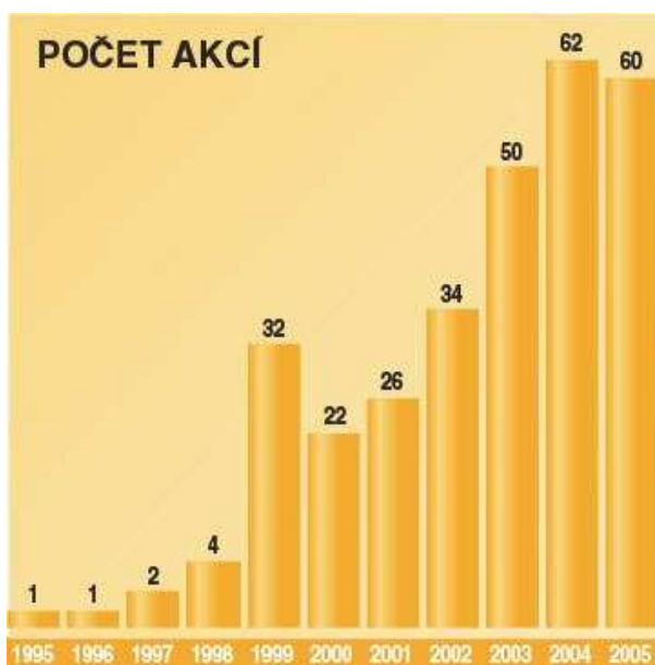
Graf č. 2

Počet organizátorů Brněnských dnů pro zdraví